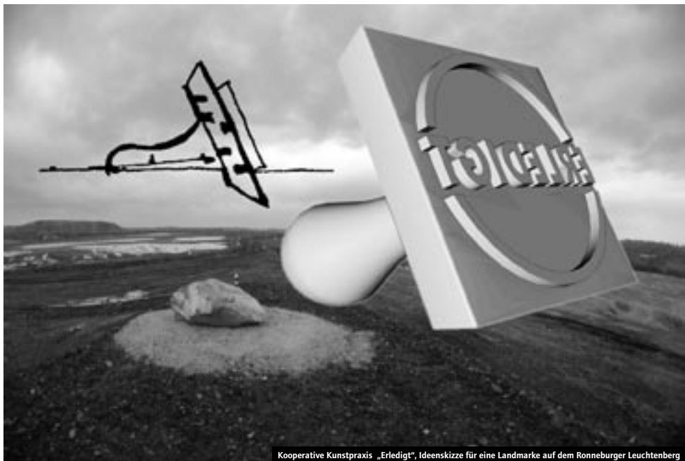
Kooperative Kunstpraxis „Erledigt“, Ideenskizze für eine Landmarke auf dem Ronneburger Leuchtenberg

GERNOT BÖHME, JENS HERRMANN, WOLFRAM HÖHNE, INES KNACKSTEDT, ANDREAS PAESLACK, BÜRO SCHRIEWER+ SCHRIEWER / WEIMAR (KOOPERATIVE KUNSTPRAXIS)