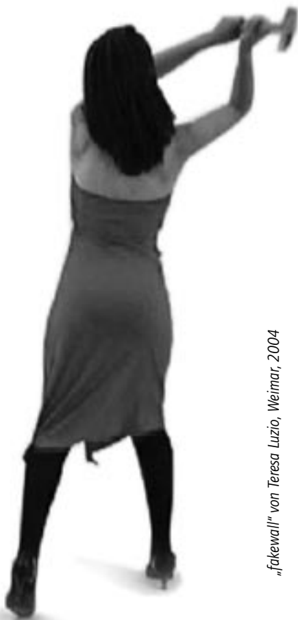
„fakewall“ von Teresa Luzio, Weimar, 2004

Das MFA Programm ist als internationaler Studiengang konzipiert. Die Unterrichtssprache ist Englisch. Das Angebot richtet sich sowohl an ausländische Bewerber als auch an deutsche Kunsthochschulabgänger, die u.a. Studiererfahrungen im Ausland machen wollen. Um den internationalen Austausch zu gewährleisten, pflegt der Studiengang enge Zusammenarbeit mit den 7 ausländischen Partnerhochschulen, an denen die Studierenden während ihres Studiums ein Semester verbringen. Die Besonderheit des MFA-Programms liegt nicht nur in der Chance der Weiterqualifikation, sondern auch im Kennenlernen unterschiedlicher Studiensysteme.