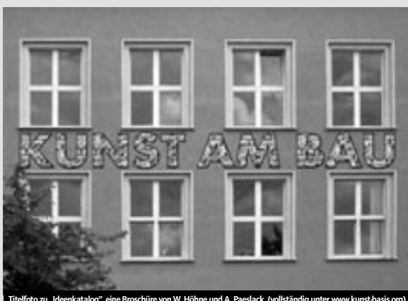
Titelfoto zu „Ideenkatalog“, eine Broschüre von W. Höhne und A. Paeslack (vollständig unter www.kunst-basis.org )

im öffentlichen Raum seit den sechziger Jahren. Eine Vielzahl von Künstlern arbeitete an dem Versuch, die Kunst in öffentliche Belange einzubinden. Der praktische Umgang mit der Kunst am Bau - Regelung beschränkt sich jedoch besonders in den neuen Bundesländern auf die Aufstellung traditioneller Genrekunst. Die Wettbewerbe werden als Verwaltungsakt gehandhabt. Alle Beteiligten meiden in der Regel die Auseinandersetzung. Gute Chancen hat, was keinen stört. So kann es unter Umständen der Fall sein, dass es für den Nutzer abwaschbar, den Architekten unsichtbar und den Vertreter des Ministeriums abheftbar sein muss. Was dabei herauskommt ist weder künstlerisch noch gesellschaftlich zu vertreten und kann deshalb, so wie es derzeit an der Tagesordnung ist, eingespart werden.