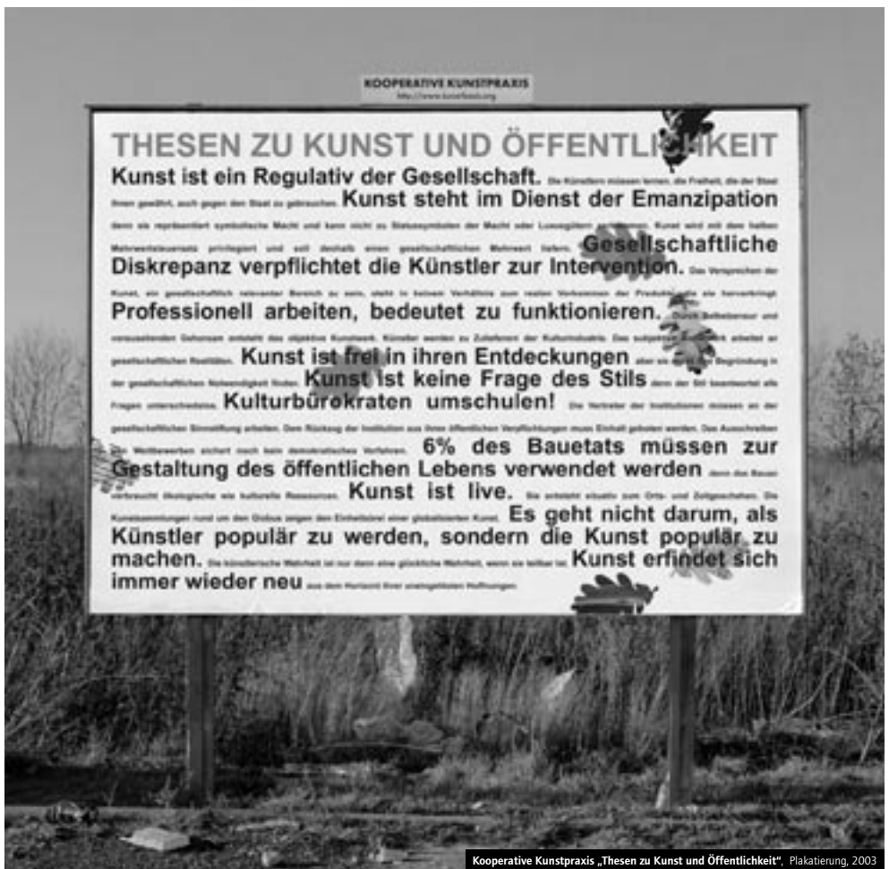
Kooperative Kunstpraxis „Thesen zu Kunst und Öffentlichkeit“, Plakatierung, 2003

Fritz Rahmann, Walter Benjamin, Woody Allen, Theodor W. Adorno, Alan Sokal und Hans Haacke. Sie haben bis heute kaum Veränderungen der staatlichen Kulturpolitik auslösen können. Dies liegt nicht unerheblich daran, dass die Diskussion um öffentliche Kunst mit veralteten Argumenten geführt wird, dass es den Entscheidungsträgern an Mut und Kompetenz fehlt, dass Künstler sich im vorauseilenden Gehorsam den Gesetzen des Marktes unterwerfen oder politische Kunstbegriffe als Argumentation benutzen, ohne sie praktisch einzulösen. Die öffentliche Plakatierung soll diese Gedanken aus der Verschlössenheit von Buchdeckeln befreien und zur Diskussion stellen. Denn Kunst erfindet sich immer wieder neu aus dem Horizont ihrer uneingelösten Hoffnungen.