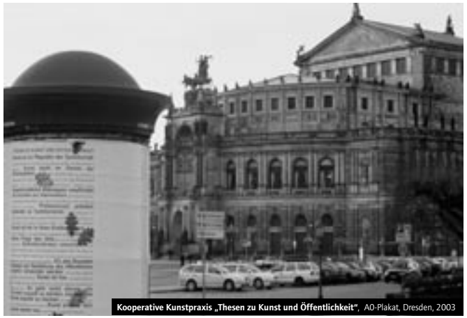
Kooperative Kunstpraxis „Thesen zu Kunst und Öffentlichkeit“, A0-Plakat, Dresden, 2003

Kunst im öffentlichen Interesse sucht nach Alternativen zu den bestehenden kulturellen Verhältnissen. Sie verlässt die hierarchische Kommunikationsstruktur weltabgewandter Produzenten und distanzierter Betrachter. Bereits in ihrer Entstehung tritt sie in eine Dynamik der Wechselseitigkeit und bleibt im Laufe ihrer Produktion veränderbar. Sie wird erst dadurch möglich, dass Künstler, Publikum und Entscheidungsträger einen unvoreingenommenen Dialog über öffentliche Fragestellungen führen und in diesen investieren. Künstler wie